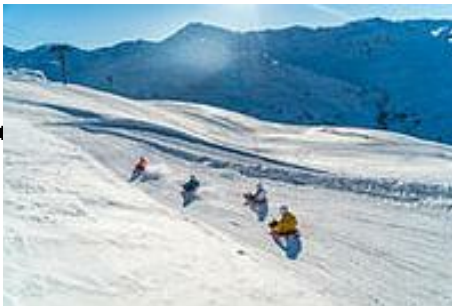
Piste de luge Roc'n Bob